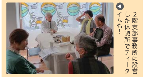
▶ 2階支部事務所に設置した休憩所でティータイムも!

待ちに待った内覧会 4月19日には地域に向けてすすめテラスの内覧会を開催しました。 1階多目的室では吹き矢体験と支部紹介の展示、2階の支部事務所では映画会。3階は歯科の事務室など各フロアの案内を行いました。 正式開業が待ち遠しい!