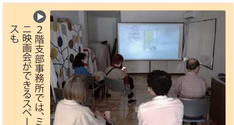
▶ 2階支部事務所では、ミニ映画会ができるスペースも

3月28日にはひばりが丘パークヒルズ南集会場で「すすめテラスオープン企画」を開催しました。62名が組合員や職員による演芸、医療相談や班会体験会に参加。どの発表も質が高く、参加者みなで楽しい雰囲気になりました。人気の麻雀班には参加希望者3名。吹き矢体験には10名以上が並びなど班会体験に興味津々。新班も誕生予定です。