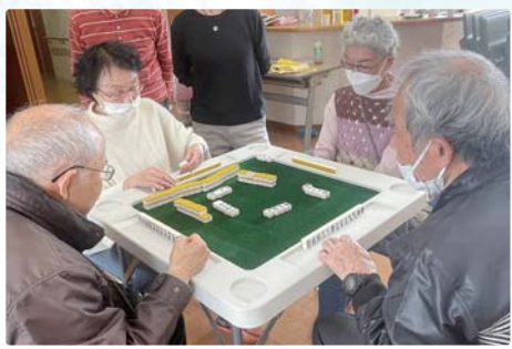
▶ 車いすでもやってみたくなるベーゴマ体験 楽しく認知症予防ができる健康麻雀班に参加希望者3人!