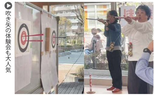
▶ 吹き矢の体験会も大人気