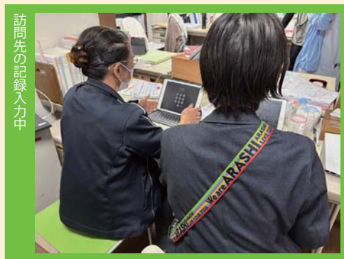
訪問先の記録入力中

最近訪問看護ステーションでは、介護者の方から「チャットपीに相談したんだけど」といった言葉を耳にする機会が増えてきました。日々の体調の変化やケアの方法について、まずは気軽にチャットGPTで調べてから専門職に相談するという流れが、少しずつ広がっている印象があります。 最近では、スマートフォンやタブレットなどを活用し、「チャット型の相談（チャットपीなど）」で健