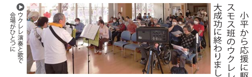
▶ ウクレレ演奏と歌で会場がひとつに

待ちに待った内覧会 4月19日には地域に向けてすすめテラスの内覧会を開催しました。 1階多目的室では吹き矢体験と支部紹介の展示、2階の支部事務所では映画会。3階は歯科の事務室など各フロアの案内を行いました。 正式開業が待ち遠しい!