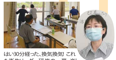
はい30分経った、換気換気！これも衛生リーダー研修的一幕。楽しい班会も衛生リーダーがいるからできるんです。

コロナ禍でもリモートで健康ウォーク交流集会を開催したり、歌えないならハンドベルは？と新しい班も誕生。つながりこそ生協の力ですね。