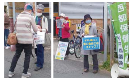
毎月小平駅頭で社保署名を続けています