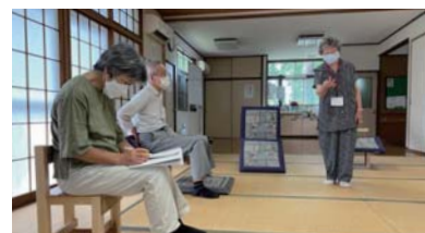
名札を下げ、感染防止に努める衛生リーダーさん

班会や会議を行うにあたり、生協活動の感染防止基準を見直しました。活動に衛生リーダーが配置され、感染防止の対策がきちんと取られていると判断しました。変更点の1つは施設利用時の人数制限です。公共施設などを利用する際、定員の3分の1を目安としていましたが、会場ごとに定められている定員の半分を上限とします。また、1回あたり1時間以内とされていた時間制限も2時