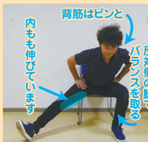
②背筋を伸ばしたまま、おへそから上体をまっすぐ前に倒す。(左右20～30秒ずつ)

運動の効果を上げるには「長く続けているけど効果が感じられない」という声をよく聞きます。効果を出すにはある程度の負荷をかける必要があります。いつも歩いているペースよりも少しテンポを上げたり、日頃より歩数を増やすなどにより運動強度を少し上げることをお勧めします。