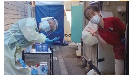
酷暑の中、完全防護服の中は...それでも笑顔で

サウナ状態で働いています。検査はしてくれただけ。その後の症状のフォローをしてくれないという相談も多く、近隣での