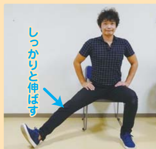
①椅子に浅く座り、片脚を伸ばして横に開く。