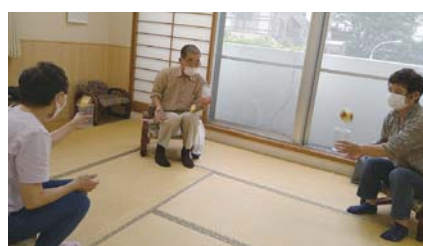
距離を取って頭の体操 難しい～

「たくさん体操できて良かった!けど家に帰るとすぐ忘れちゃう(笑)」 「いっぱい笑った! コロナで家から出られないのがつらい!笑うことが少なくなった!」やること