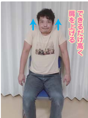
②肩を上げる→下ろすを繰り返す。