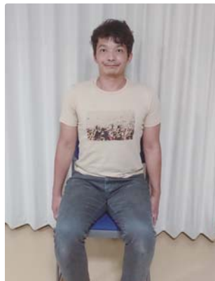
①イスまたは床に座り、背筋を伸ばす。