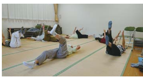
「あと何回やるの〜」きつい腹筋!笑顔で奮闘中!!

三花支部(小平市)でみんなと楽しく体操を中心に行っています。いつも行う2週目の水曜ではなく、この日は1週目の開催だったため、いつもとは違い久しぶりに来られた方もいらっしやいました。「自宅ですつとゴロゴロしてたからきた」「暑くて調子悪かったけど、体操して元気出た」笑顔が絶えないこの班会。「いろんな方にお会いできて心が洗われる。本当に良