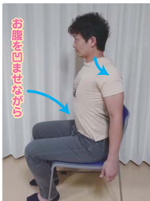
③肩を後ろに胸を張る。→①に戻す。