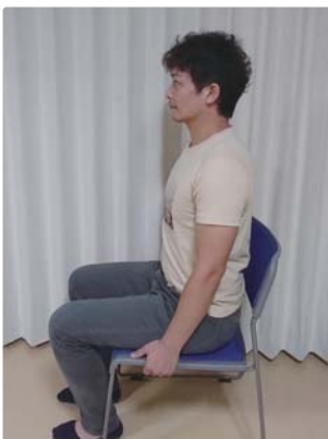
①イスまたは床に座り背筋を伸ばす。