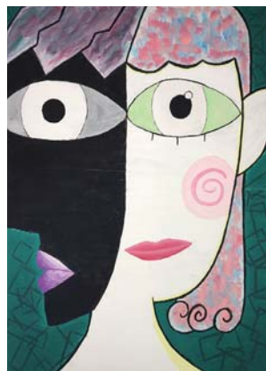
組合員の娘さん(高校生)の作品です。これからいろいろなMISORAを見せてね。(母より)