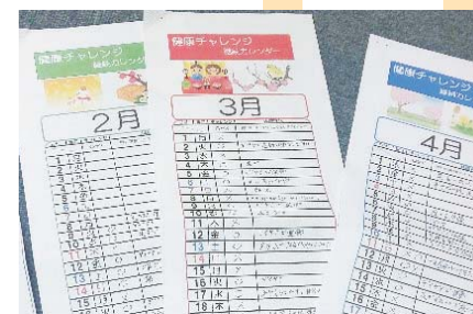
巣ごもり中 チャレンジいろいろ