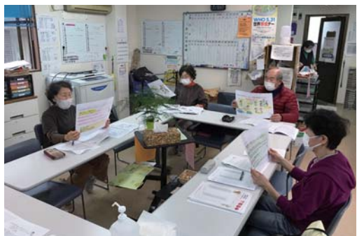
東久留米で衛生リーダー育成研修

東村山・中央支部のあ んず班のお二人が秋の健 康チャレンジのあと、引 き続きチャレンジに取り 組みチェックしたカレン ダーを提出してくれまし た。話を聞いていた方も 「提出していないけど続 けているわよ」と。健康 チャレンジの輪が広がっ ています。また、2年前 の健康ウォーク交流集会 で開眼片足立ちが5秒 しかできなかった組合員 さんは、その後毎日片足 立ちを続け、1年で1 分間立ち続けられるよ