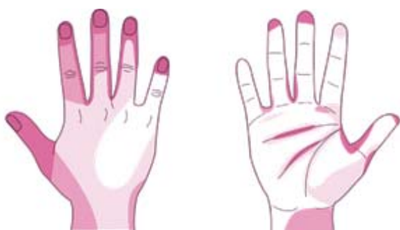
最も洗い残しがある部分 次洗い残しがある部分

新型コロナウイルスのワクチンを接種しても、感染予防は必要です。新型コロナウイルスは発症前2日から人に移すことがあるため、症状が無くても「移さない」「移らない」対策を！基本の「マスク」「手の衛生」は徹底しましょう。