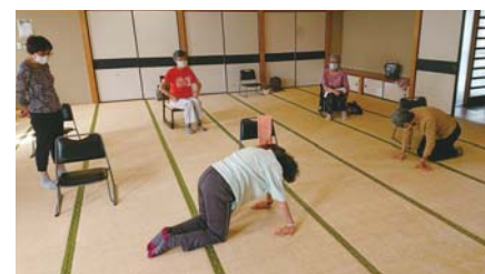
「家ではこんな体操してる」と交流中

四支部(小平市)の体操班「のびのび班」は脳トレとストレッチを中心にしています。衛生リーダー研修も班の中で2名受講されてコロナ感染予防はバッチリ! この日も1時間みっちり体操! 参加された方は「月に1回だから楽しみにしていた」「雨の中で来る気がしなかったけど来てみんなで話し合うことで元気が出た! 帰ってから畑仕事がんばろう!」