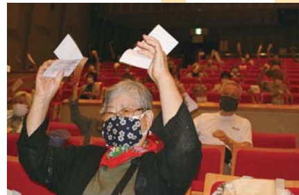
議案は賛成多数で元気に可決しました

とをたくさん経験しているのも生協の素晴らしいところだ。1年だったとふりかえりました。経営活動も年度初めは受診控えなどの影響を受けましたが、組合員からの増資、職員力の力になり、昨年度を上回る事業収益になったと報告がありました。 10年先の生協を見据えて 2021年度は「いつまでも安心して住み続けられるまちに——10年先の生協を見据え、今私たちがやるべきことを考える」をスローガンとし、