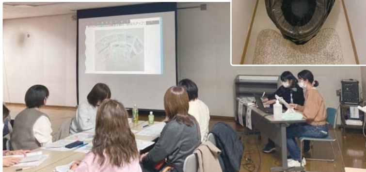
▶ 発表を熱心に聞く看護師

東日本大震災が発生して今年で14年、昨年の元日にも能登で震災が起きました。災害はいつ、どこで起きるかわかりません。昨年の西都看護活動交流集会で「災害時のトイレ」が健康被害にどれだけ影響するか発表しましたが、みなさまにも知っていただきたいと思えます。