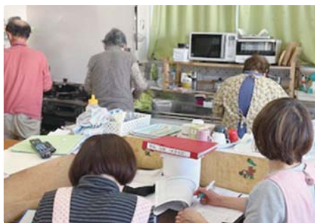
いっただってみんなで作ります