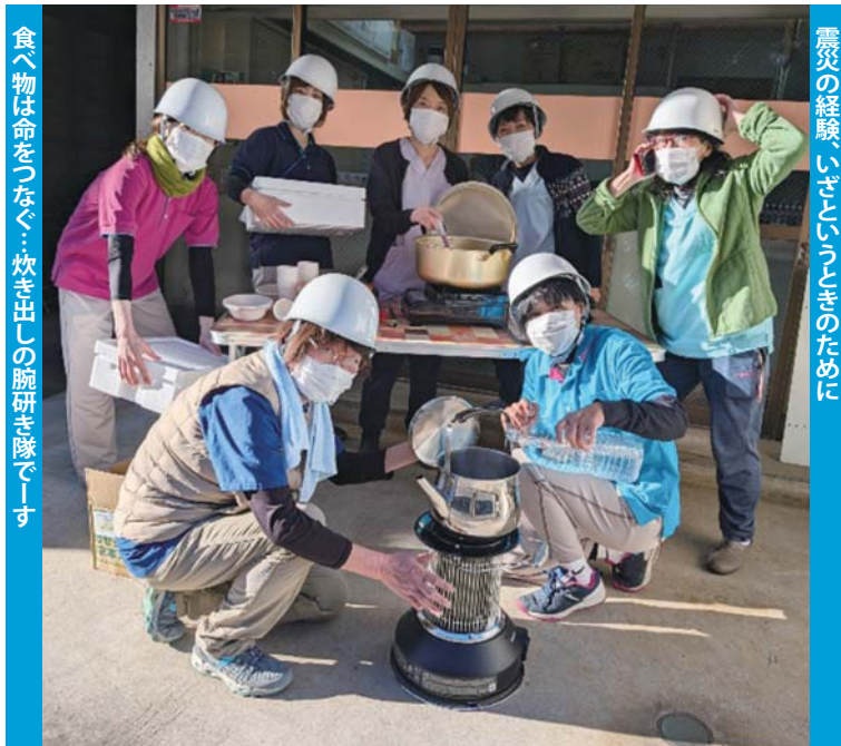
食へ物は命をつなぐ...炊き出しの腕研ぎ隊です