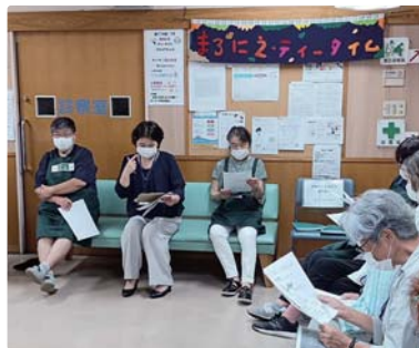
▲東久留米のまろにエティタイム