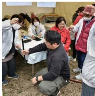
▲西東京市・市民まつりで