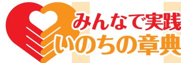
震災の経験、いざというときのために