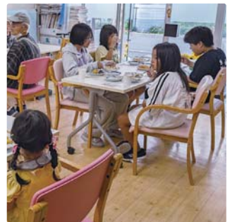
▲東村山でこども食堂