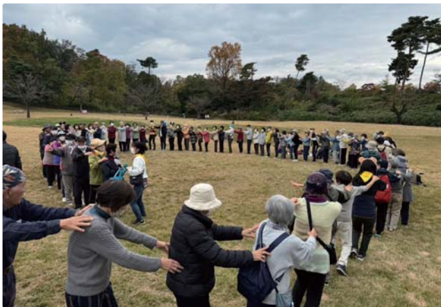
▲健康ウォーク交流集会 童心に帰ってじゃんけん列車でつながりました