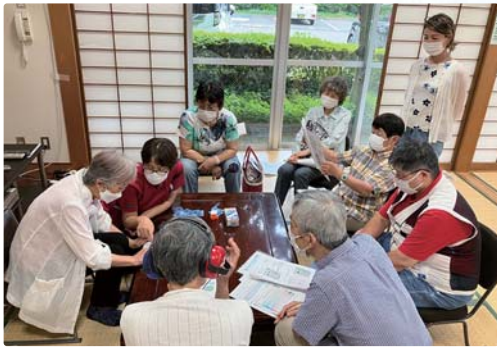
▲小平で難聴チェック講習会