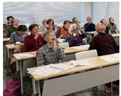
▲おくちの健康チェック&元気度チェック学習会