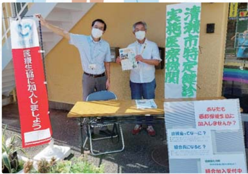
▲北多摩クリニックの前でお声掛け

参加するには時間や勇気がない方は、機関紙きずなや支部ニュースなどを読んで、私たちの活動を知っていただければと思います。