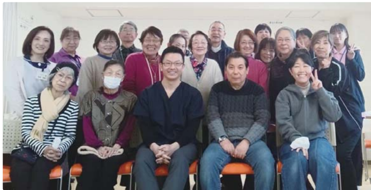
▲ 清瀬診療所職員と清瀬西支部運営委員のみなさん