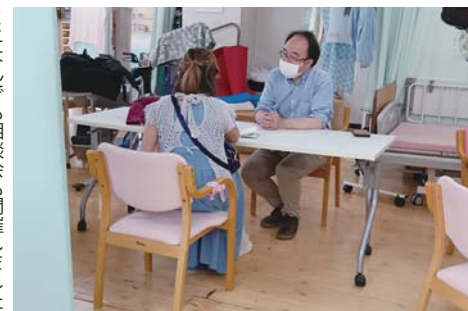
ミニなんでも相談会も開催しました

次回フードバンクは12月14日です。品物の提供とお知らせなどのご協力をお願いします。