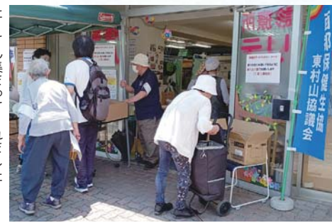
たくさん集まってくれました