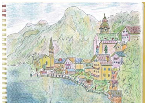
妻との思い出の場所。 たくさんの絵の中でも気に入っている1枚です。