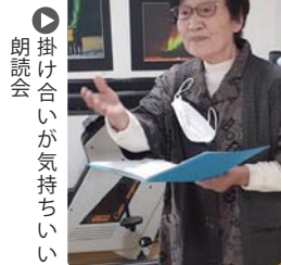
朗読会 掛け合いが気持ちいい 奏者から演奏だけでなく プレゼントの準備まで楽しみな演奏会