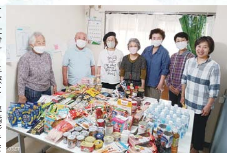
さて仕分け！手際よく準備できました