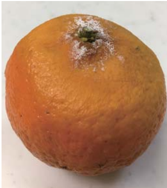
これが、耳の中にあるカビのイメージです。