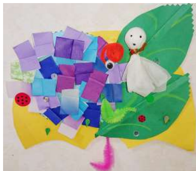
お孫さんとの共同の作品です。何がかかれてるかな？