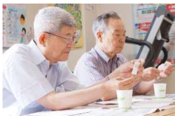
健康チェック実践研修の尿チェックの実践中

「新しい班を作りたいと思つて…」6月7日に開催した健康チェック実践研修参加者の声です。西都保健生協には地域に班がたくさんあります。班は医療生協ならではの健康チェック班を開く