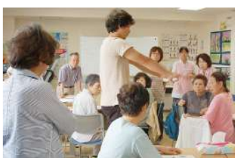
健康チェック実践研修 体組成測定 みなさんとおも真剣です

「新しい班を作りたいと思つて…」6月7日に開催した健康チェック実践研修参加者の声です。西都保健生協には地域に班がたくさんあります。班は医療生協ならではの健康チェック班を開く