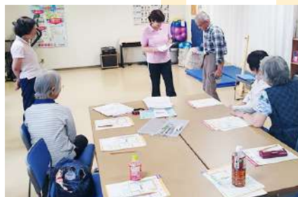
東久留米西支部のピリカート班は、年に1度は健康づくりセンターで健康づくり健診実施