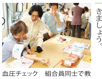
血圧チェック 組合員同士で教えあつて

「新しい班を作りたいと思つて…」6月7日に開催した健康チェック実践研修参加者の声です。西都保健生協には地域に班がたくさんあります。班は医療生協ならではの健康チェック班を開く